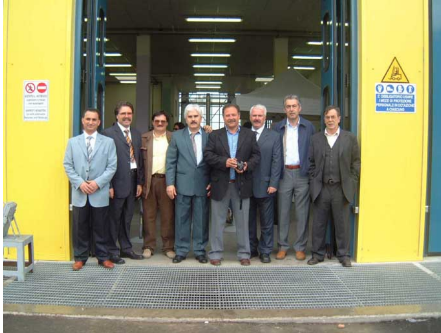
Lo staff PRO.CAT